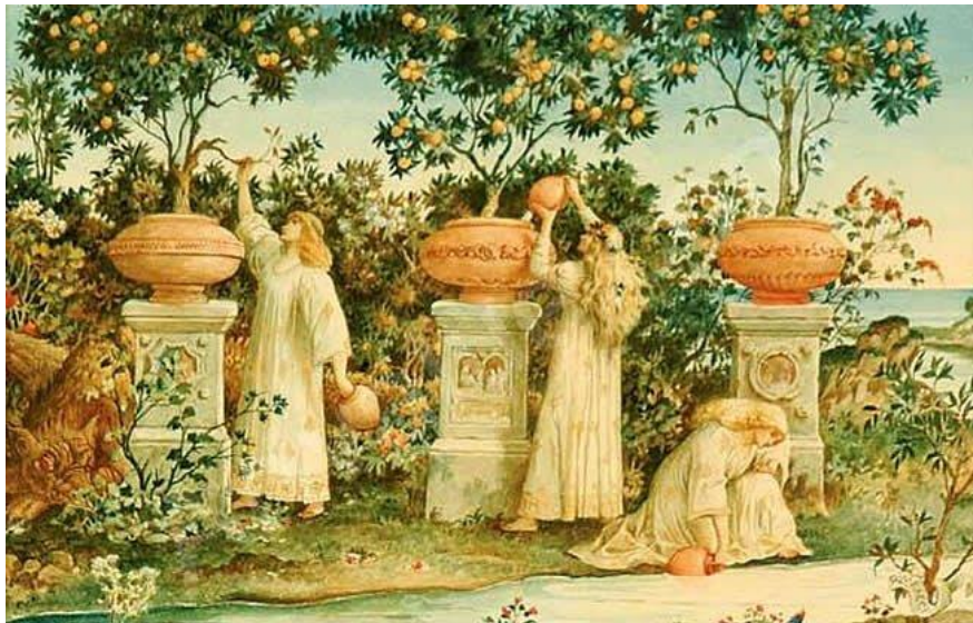
El Jardín de las Hespérides

FESTIVAL DE CRISTO FESTIVAL DE LA HUMANIDAD DÍA MUNDIAL DE INVOCACIÓN