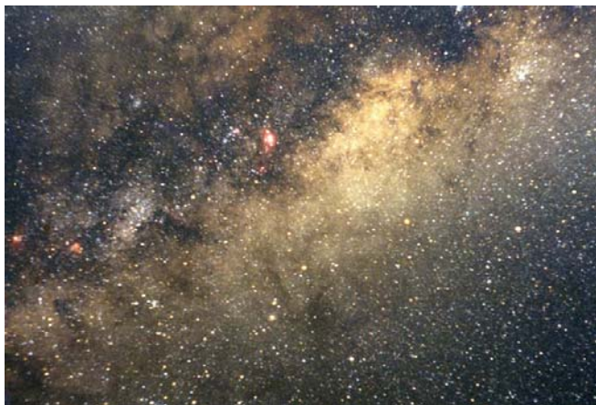
Región celeste donde se encuentra el CG

Astronómicamente: el punto medio matemático de cualquier sistema galáctico (no obstante, de manera especial, la zona central de nuestra galaxia, la Vía Láctea).