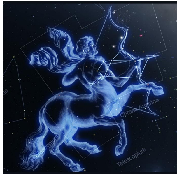
Constelación de Sagitario